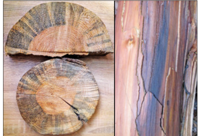
Рис. 1. Бактеріальний опік у верхній частині стовбура Abies alba (уражені трахеїди на поперечному (зліва) та на поздовжньому розрізах)

гії хвойних зміна забарвлення трахеїд розпочинається з верхньої частини крони, поступово поширюючись до основи стовбура (рис. 1).